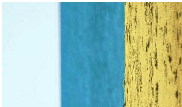
Picture of a Canary Islands Beach