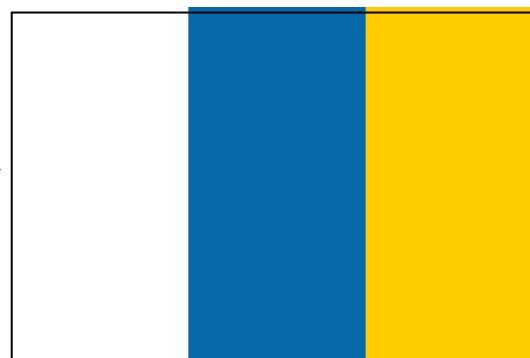
Flag of the Canary Islands